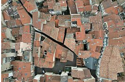
vue en drone du quartier