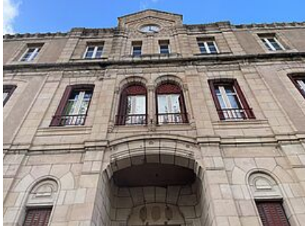
La façade située bd de l'Ayrolle sera conservée