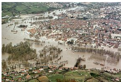
Crue historique de 1982