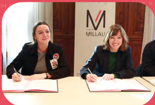
Une convention signée entre l'Établissement public foncier d'Occitanie et la Ville de Millau.