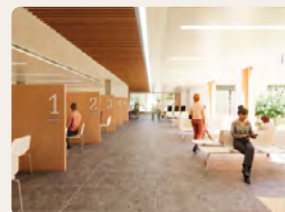
Les admissions situées dans la rue intérieure bénéficient de la lumière naturelle