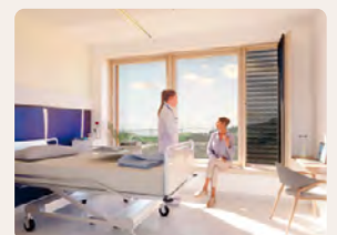
Chaque chambre bénéficie d'une vue sur le paysage aveyronnais