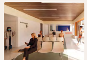
Calme et chaleureux, le hall des urgences participe à la qualité de prise en charge des patients