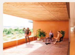
En face du poste de soin, au cœur de chaque unité, une loggia sert de "place"