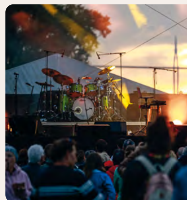
Liloë et son violon avec un ciel