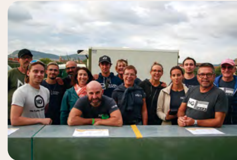
Les bénévoles des Natural Games