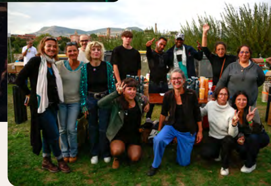
Les bénévoles de Myriade