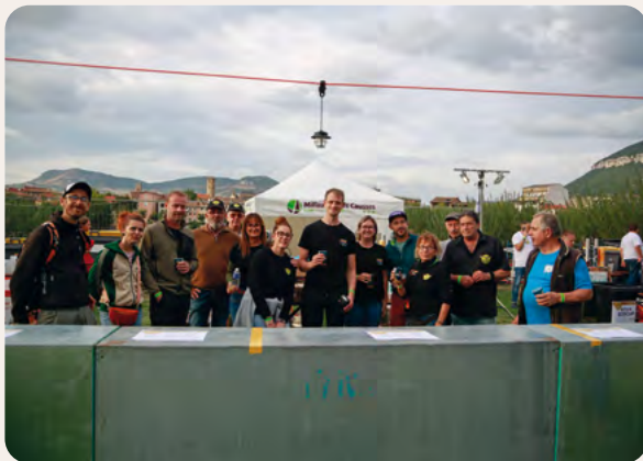
Les bénévoles de la MJC