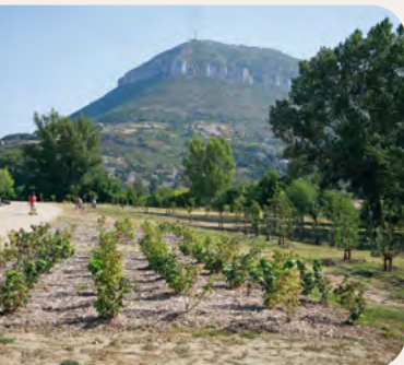
Vergers des templiers