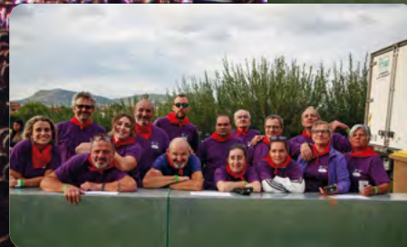
La belle équipe du Som handball