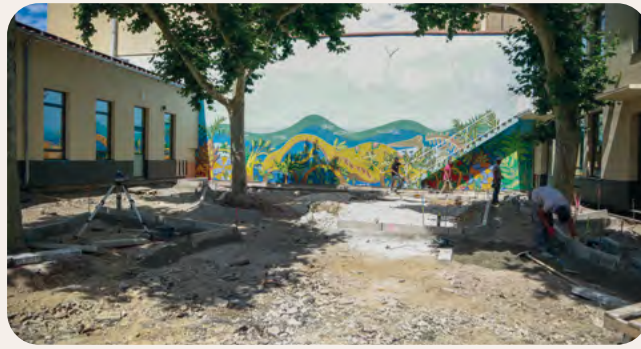
Les travaux de végétalisation de la cour d'école de Jules-Ferry