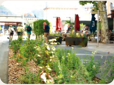
Le boulevard de Bonald