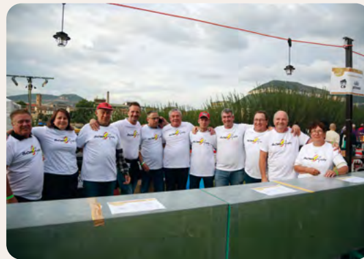
Les bénévoles du SOM Rugby