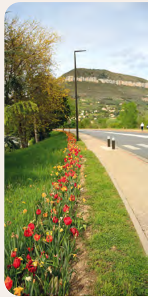
RD809 ville fleurie