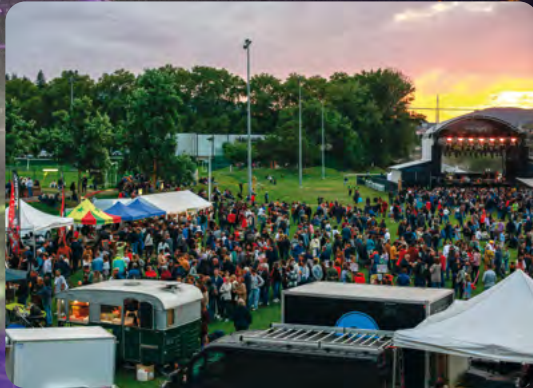
Restauration locale et cuisine du monde pour régaler les papilles