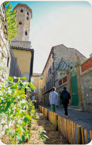
Végétalisation du Beffroi