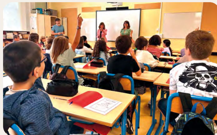
Rentrée scolaire à l'école Martel