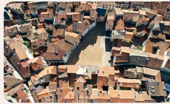
L'îlot des sablons se transforme