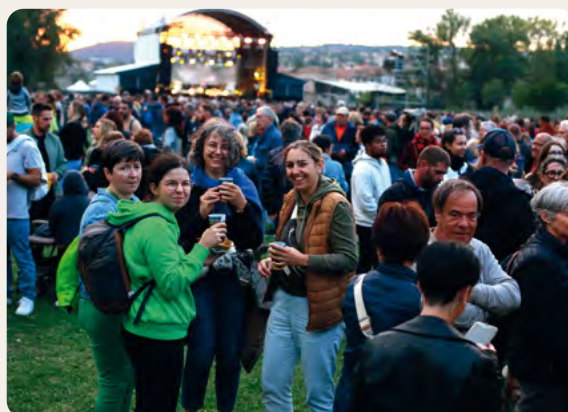
Les Millavois en famille pour profiter de cette grande soirée