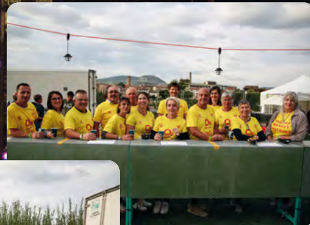
Le collectif du Som basket